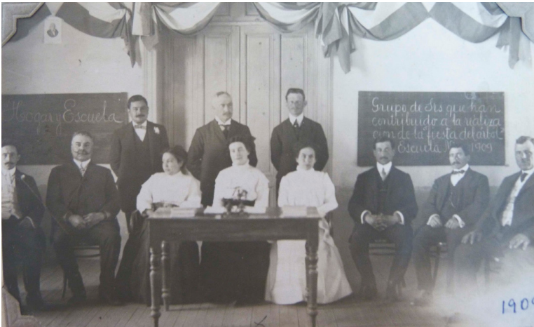
Figura 3. Comisión Fiesta del árbol 1909