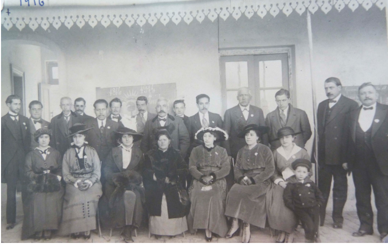
Figura 2. Imagen educacioncitas y elite local en el Centenario de la Independencia. Escuela n° 32 Gral. Roca.