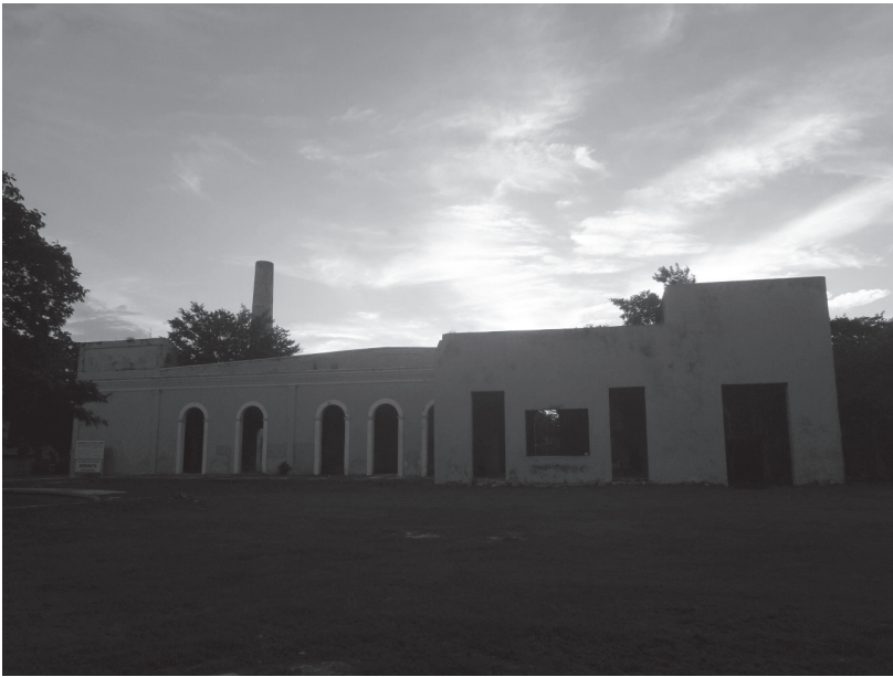
Figura 2. Casa de máquinas de Xcumpich

En ese espacio se colgaban hamacas para que durmieran los habitantes y también estaban sus muebles, entre los que destacaban los roperos en un lado y, en el otro, la “mesa de los santos” usualmente presidida por la Santa Cruz, acompañada de otras imágenes religiosas y de las fotografías de familiares fallecidos. Todo ello quedaba protegido por una techumbre sólida de cubiertas planas con base en vigas de hierro. Si bien predominaron en las casas principales, dependiendo del desarrollo económico y constructivo de la hacienda, también fueron incorporadas en las casas de los trabajadores. 67 Estas viviendas eran otra señal del prestigio y de la bonanza de Xcumpich. La calidad de los materiales se evidencia ya que todavía se conservan en buen estado la casa de máquinas y la casa principal, todavía en uso como vivienda (Figura 2). 68