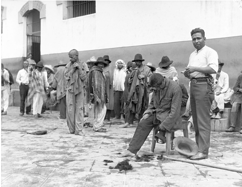
“Peluquero corta el cabello a interno de La Castañeda” (negativo de película de nitrato: 12.7 x 17.8 cm.), México, D.F. c. 1935. © CONACULTA.INAH.SINAFO.FN.MÉXICO, Archivo Casasola, No. Inv. 366986.