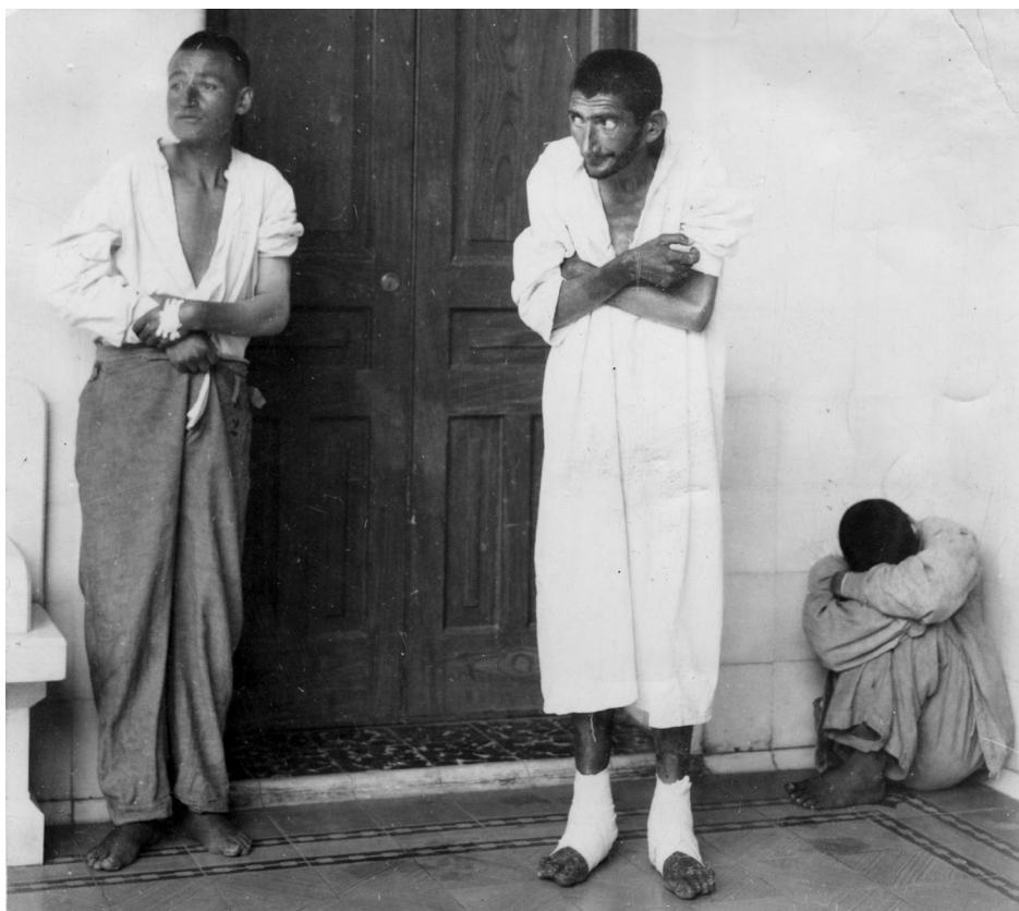
“Grupo de esquizofrénicos, retrato” (impresión plata sobre gelatina (entonada y manipulada: 10.2 x 12.7 cm.), México, D.F. c. 1940. © CONACULTA.INAH.SINAFO.FN.MÉXICO, Archivo Casasola, No. Inv. 461041.